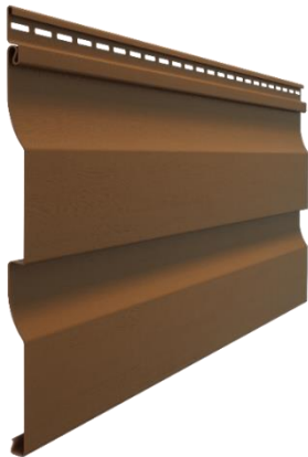
Сайдинг D4,5D (корабельный брус, 4,5")